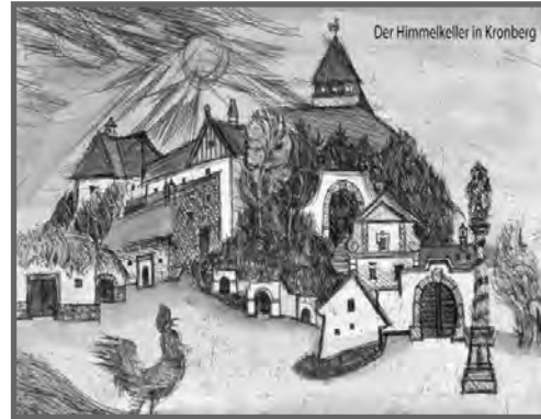
Der Himmelkeller in Kronberg Grafik von Prof. Hermann Bauch

Nach einer ausgiebigen Rast ging es weiter zur Besichtigung des Museum in Kronberg, wo wir an einer interessanten fachmännischen Führung teilnahmen. In der noch warmen Sonne verging die Pause sehr rasch und die Teilnehmer verabschiedeten sich nach einer gelungenen und unfallfreien Ausfahrt und traten die Heimreise an