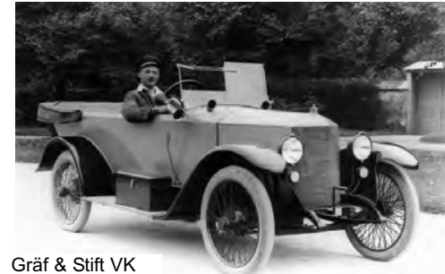
Gräf & Stift VK

Stadtwagen keine billige Ausführung der Luxusfahrzeuge sei, sondern mit dem gleichen, hochwertigen Material und mit der gleichen Sorgfalt, nur eben kleiner gebaut werden.