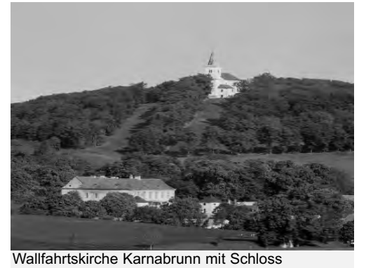
Wallfahrtskirche Karnabrunn mit Schloss

Bei schönem Herbstwetter ging es in Richtung Norden durch die leicht hügelige Landschaft. An der Spitze, der fast immer geschlossen fahrenden Fahrzeuggruppe, gaben die älteren Fahrzeuge das Tempo an. Gemütlich ging es zur Bergkirche von Karnabrunn. Hier war für die Messebesucher der Erfrischungsstand geöffnet, wo sich auch die Teilnehmer der Ausfahrt mit