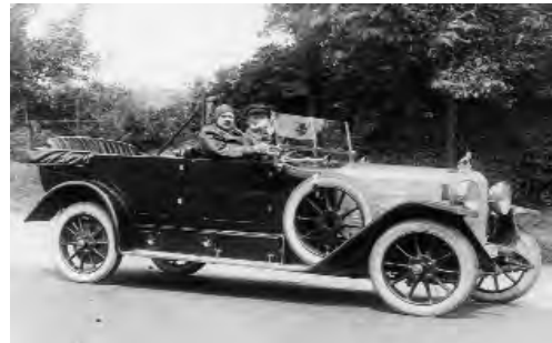
Kammersänger Leo Slezak im VK 1

Stadtwagen keine billige Ausführung der Luxusfahrzeuge sei, sondern mit dem gleichen, hochwertigen Material und mit der gleichen Sorgfalt, nur eben kleiner gebaut werden.