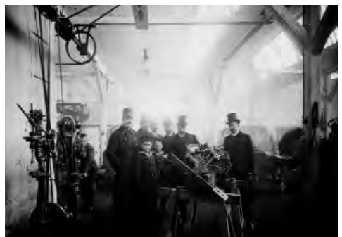
Erzherzog Salvator besucht Gräf & Stift und lässt sich von den Brüdern Gräf einen Luftschiffmotor zeigen