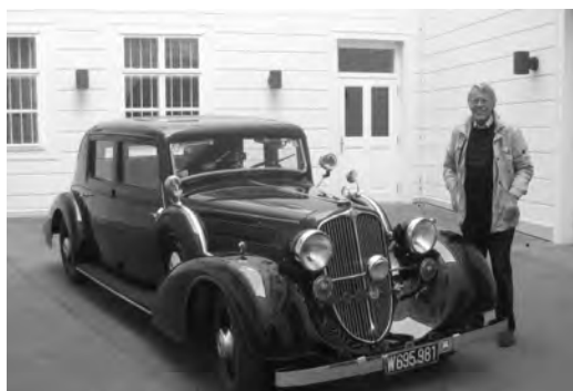
Steyr 530, Bj. 1935 bei der Pressekonferenz in Wien

Eine davon wird erstmalig die Geschichte der österreichischen Automobilgeschichte mit deren noch heute gültigen Erfindungen sein.