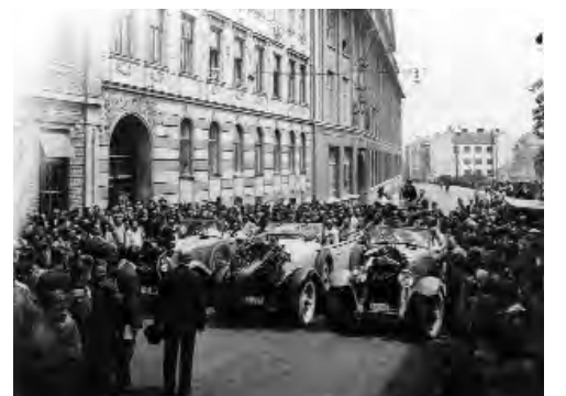
Alpenfahrt 1930 - die siegreichen Gräf & Stift SP5 und SP 8 Teams

dementsprechend teuer. Bis ca.1936 wurden 30 Stück gebaut. Diese Stückzahl erscheint heute lächerlich gering, aber man sollte bedenken, es war die Zeit der Wirtschaftskrise und teure Luxusautos waren