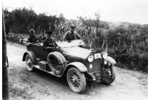
Kaiser Karl fährt im Gräf & Stift

Nach dem ersten Weltkrieg stellte Gräf & Stift seine Produktion auf Friedensprodukte um, forcierte den Bau von Lastwagen und Autobussen, stieg aber auch wieder mit einem neu entwickelten Sechszylindertyp - SR 2 und SR 3 - in den Personenwagenbau der Luxusklasse ein.