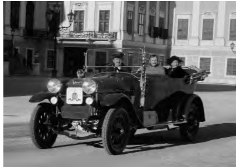
Der Kaiserwagen bei Filmaufnahmen im Ehrenhof von Schloss Schönbrunn

1974 gelang es der ÖAF Gräf & Stift AG das Fahrzeug zu erwerben und nach Österreich zurück zu bringen. Heute ist es im Besitz des Vereins zur Förderung der historischen Fahrzeuge der Österreichischen Automobilfabriken.