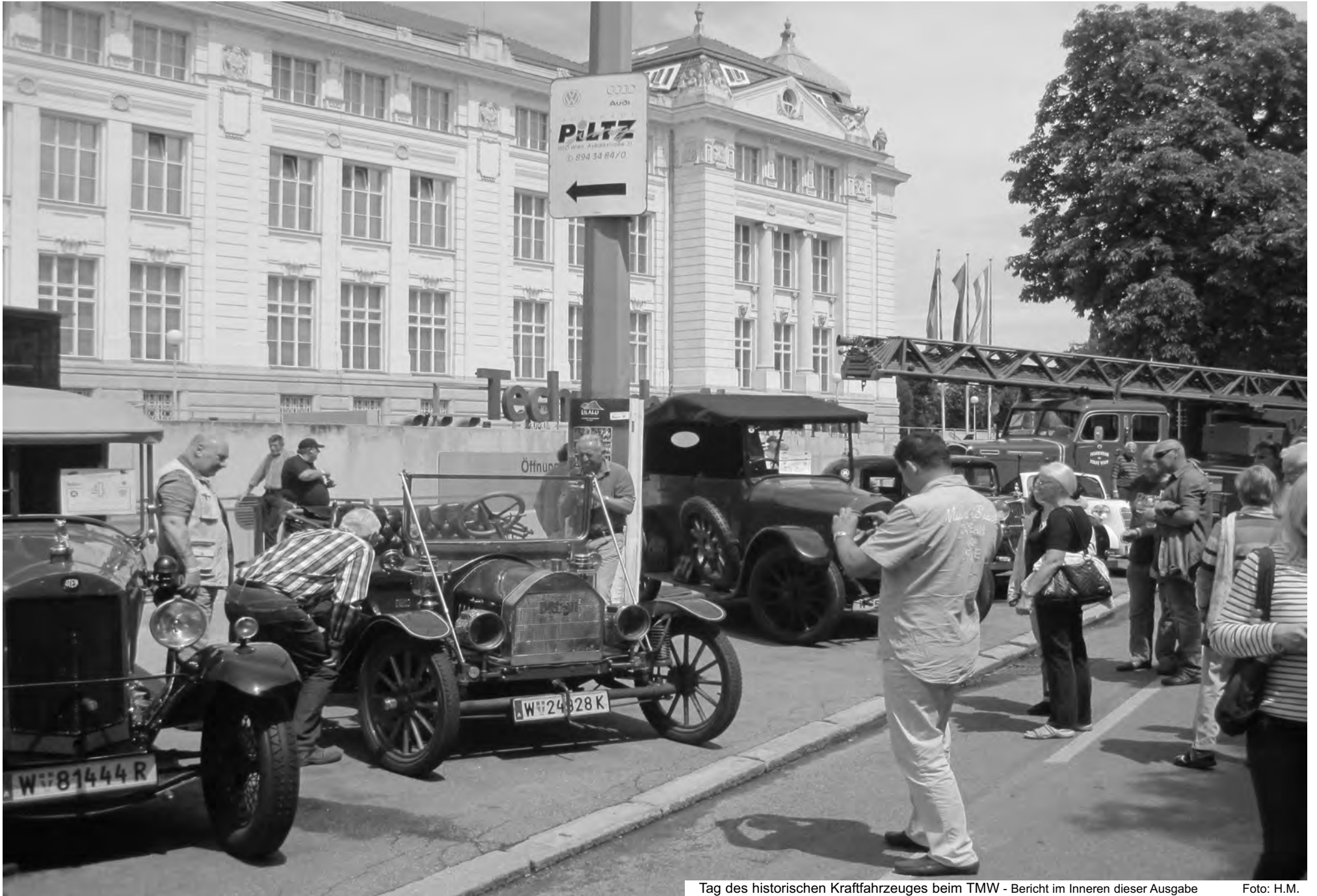
Tag des historischen Kraftfahrzeuges beim TMW - Bericht im Inneren dieser Ausgabe