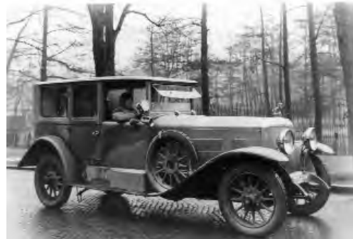
Wien in 24 Stunden Fahrzeit - führten zum Beinamen „der österreichische Rolls Royce“

Gräf & Stift SR 2 fährt die Strecke Hamburg -