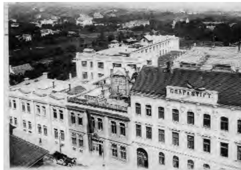
Das Gräf & Stift Werk wurde schon 1909 auf 8000 m² verbaute Fläche erweitert. Die Aufnahme stammt von 1916

führen und seither thronen die Löwen auf jedem Gräf & Stift Kühler