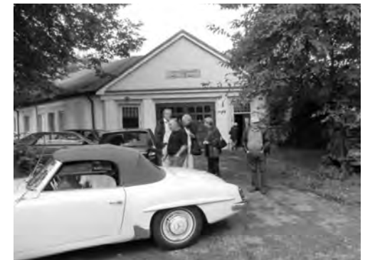
Beim Automobil- und Motorradmuseum Austria in Gramatneusiedl