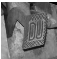
Pedal mit DU-Zeichen