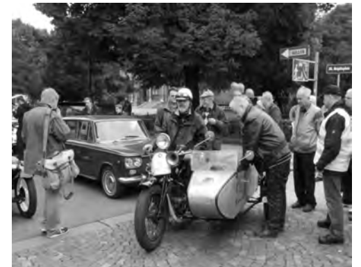
das Gespann beim Start am Brigittaplatz