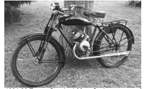
1934-39 Tempo Standard 98 cc Sachs