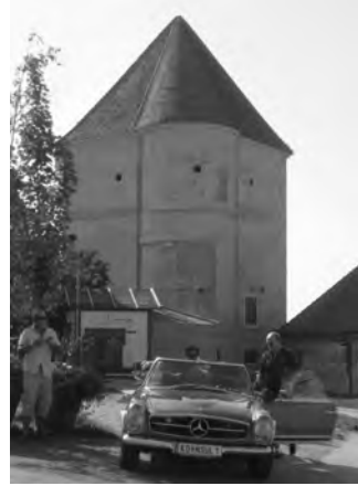
Text: W.D.

Auf Grund der Berichterstattung in der Bezirkszeitung über unsere Veranstaltung haben sich vor unserem Eintreffen viele Menschen vor dem Eingang versammelt. Die Teilnehmer, die tapfer ausgehalten haben, wurden mit einem wahren euphorischen Empfang willkommen geheißen. Die Veranstalter vom Schloss Neugebäude haben für jedes Fahrzeug Gutscheine für Essen und Trinken gesponsert. Ich möchte besonders den Teilnehmern, die trotz der enormen Hitze bis zum Ende durchgehalten haben, danken. Es wäre für die wartenden Menschen, die uns begrüßt haben, und ganz besonders für die nächste Schloss-Ausfahrt, nicht von Vorteil gewesen, wenn weniger Fahrzeuge zur Besichtigung aufgestellt gewesen wären.