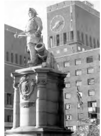
Oslo-Frognerpark u. Rathaus

und natürlich alle Typen von TEMPO, der einzigen norwegischen Motorradmarke. Alles kleine Maschinen, mit Sachs-Motoren, vom 98er Vorkriegsmodell bis zu 175er Trial-Maschinen der 50er und 60er Jahre. Es regnete viel, aber es war trotzdem eine nette Ausfahrt zu einem Flößer-Museum an der Glomma. Ich bekam für die weiteste Anreise ein Erinnerungsgeschenk. Am nächsten Tag brachte mich Sten zum Bahnhof; da gibt es eine ermäßigte Fahrkarte