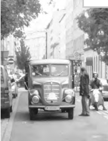
ÖAF 2 D 50, Baujahr 1952 beim Start am Brigitta- platz

Die Bezirksorganisationen Brigittenau und Leopoldstadt und die Österreichische Gesellschaft für historisches Kraftfahrwesen veranstalteten am 21. und 22. September 2013 zum 10. Mal die touristische Ausfahrt „Preis des Bürgermeisters der Stadt Wien“ .