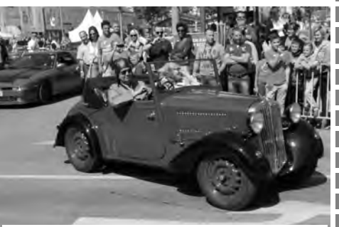
Der Skoda Popular Roadstar 418, Bj. 1934, beim Start am Hauptplatz in Mistelbach