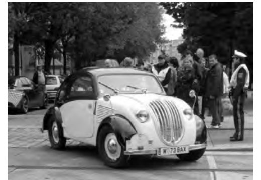
Das Steyr-Baby beim Start am Brigittaplatz zur Fahrt um den Preis des Bürgermeisters von Wien