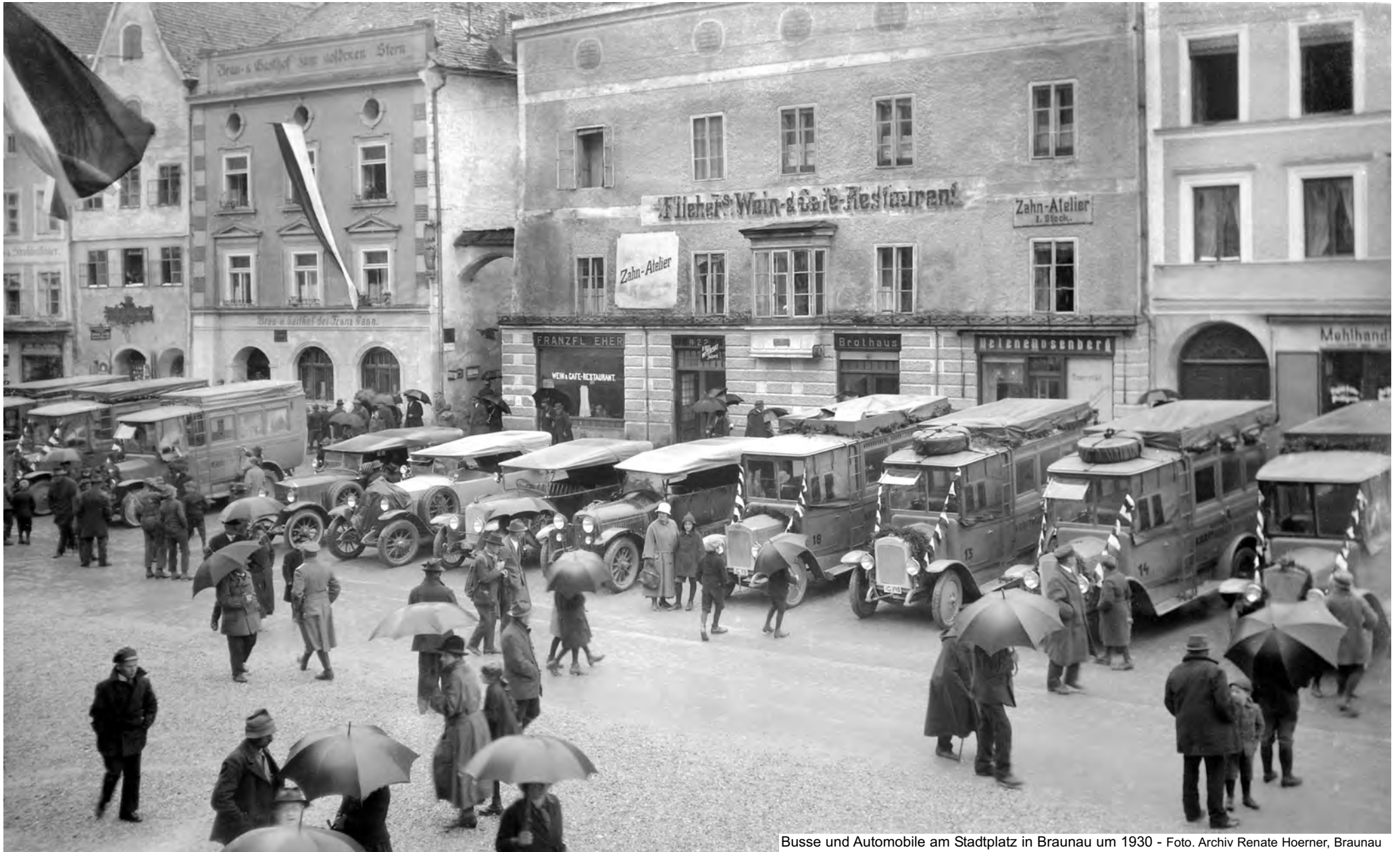
Busse und Automobile am Stadtplatz in Braunau um 1930