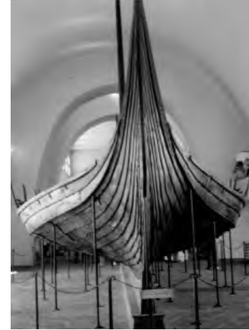
das Oseberg Schiff

Oslo konnte ich schon von 1958. Ich besuchte diverse