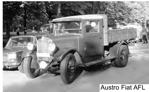
Austro Fiat AFL

die Bezirke Brigittenau und Leopoldstadt mit Durchfahrtskontrollen und Sonderprüfungen. Das Ziel der ersten Etappe war wieder in der Prater Hauptallee.