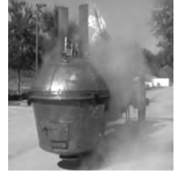
Ein „furchterregender“ Anblick:

Gribeauval musste sich aus der Politik zurückziehen und ohne Förderer wurde auch das Projekt des Fardiers aufgegeben. Das Fahrzeug stand jahrelang im Arsenal von Paris herum; im Lauf der Jahre verschwanden alle Buntmetallteile von dem Fahrzeug und als man es nach 1800 ins Militärmuseum verlagerte, mußten diese Teile ohne Zeichnungen nachgefertigt werden. Man hätte noch die Möglichkeit gehabt, Zeitzeugen aufzutreiben, die berichtet hätten, wie die ursprünglichen Teile gestaltet waren, aber das war wohl zu viel Aufwand. Der Fardier wurde nur optisch wieder hergestellt. Es zeigt eigentlich nur, daß man sich der Bedeutung dieses Fahrzeuges überhaupt nicht bewußt war. Daß es den Fardier überhaupt gibt, war auch nur einem kleinen Personenkreis bekannt, aber wenn man bedenkt, daß es eine militärische Entwicklung war, die im abgeschirmten Areal des Arsenals mit Militärpersonal durchgeführt wurde, somit Presse und private Interessen ausschloss, wird das verständlich. Es sollte aber heute, mit unseren Kenntnissen der weiteren Geschichte, kein Thema sein, Joseph Nicolas Cugnot seinen gebührenden Platz in der Geschichte als Erfinder des ersten Automobils anzuerkennen. Das würde auch die Leistungen der späteren Erfinder sicherlich nicht schmälern