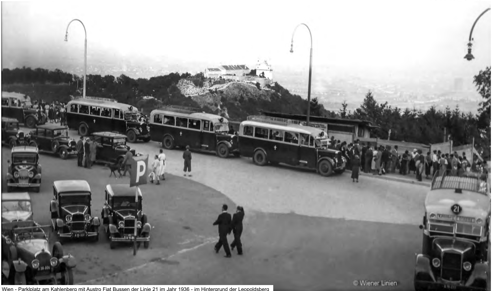
Wien - Parkplatz am Kahlenberg mit Austro Fiat Bussen der Linie 21 im Jahr 1936 - im Hintergrund der Leopoldsdorf