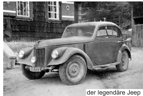
der legendäre Jeep