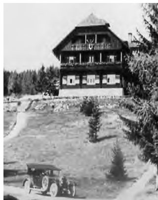
der Austro Daimler vor dem Hubertushof

Mein Vater, einer von 4 Brüdern, war der Erbe des 1927 erbauten „Hubertushof“ auf 1200m Seehöhe, 1,5 km vom Pretalsattel entfernt. Die Straße, damals ein Karrenweg, wurde händisch verbreitert, sodaß man mit einem Auto den Hubertushof von Veitsch bzw. Turnau aus erreichen konnte. Damals hatte die Straße eine Steigung von 31% und war damit eine der steilsten Übergänge in Österreich. Der Hubertushof galt seinerzeit als einer der schönsten Hotelbauten in den Bergen der Obersteiermark. Alles, was gut und teuer war wurde verwendet.