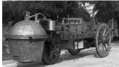
Der fahrbereite „Fardier“ Nachbau des Tampa Bay Museums in Florida

Im Siebenjährigen Krieg war man mit der fatalen Situation konfrontiert, daß teure und für die Truppe nahezu überlebensnotwendige Geschütze manchmal bei Stellungswechsel zurückgelassen werden mußten, da die dafür notwendigen Zugpferde nicht mehr vorhanden waren. Pferde garantierten die Mobilität und waren daher selbstverständlich eines der wichtigsten Ziele des Gegners. Sie zu vernichten oder gar dem Gegner wegzunehmen, bedeutete für die betroffene Truppe, sich nur mehr zu Fuß bewegen zu können und natürlich auch nur das mitzunehmen, was man gerade noch tragen konnte.