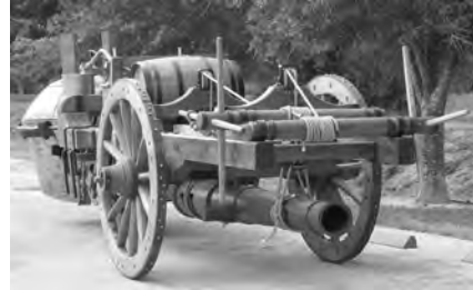
Das Geschützrohr wurde mit Seilwinden von unten in den Rahmen gehoben und so transportiert

wurde das Rad eingeschlagen. Drehpunkt war ein Pivotzapfen genau über dem Radmittel. Auf dem Eisenrahmen waren die beiden Dampfzylinder so angeordnet, dass die Kolbenstangen links und rechts vom Rad über eine Klinke auf ein Segmentrad wirkten. Der eine Kolben drückte auf das Rad und zog gleichzeitig den zweiten Kolben wieder hoch, dann wurde umgesteuert und das gleiche passierte auf der anderen Seite. Jeder Kolbenhub drehte das Segmentrad und das damit fest verbundene Vorderrad um eine Viertelumdrehung weiter. Das schwierigste für Cugnot war, einen Hersteller für die beiden Zylinder aufzutreiben. Er fand die Kanonenbohrerei in Straßburg, sie konnte Zylinder mit maximal 12 Zoll Durchmesser bohren. Mit diesem Antrieb wurde eine Geschwindigkeit von ca. 4 – 6 km/h erreicht. Cugnot hatte nicht zuviel versprochen – der 48 Pfünder wurde transportiert.