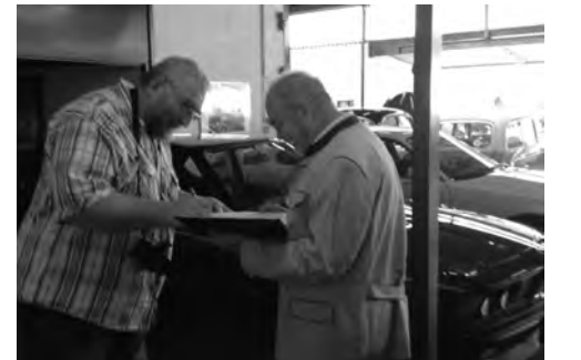
auch ins Gästebuch mußten sich alle eintragen

Der Ausklang der Herbstausfahrt 2015 fand beim Mittagessen im Heurigen-Restaurant Gross in Möllersdorf statt. Das ausgezeichnete und ausreichende Mittagsbuffet – auf Einladung der ÖGHK – haben die Teilnehmer sehr genossen und das schöne Ambiente des Lokals hat zu längerem Verweilen eingeladen.