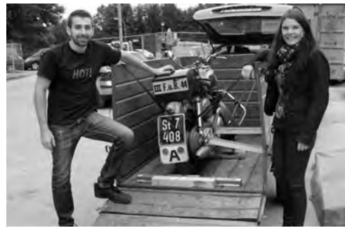
Das Team des Feuerwehrmuseum Groß St. Florian bringt das Puch-Feuerwehrmotorrad

Der zweite Tag der Veranstaltung „Mythos Puch 2015“ war „Der Straße des 20. Jahrhunderts – Originalfahrzeuge aus 100 Jahren“, - gewidmet. Im Altstoffsammelzentrum von Albersdorf – Prebuch – einer riesigen Halle – wurde mit verschiedensten Fahrzeugen die gesamte Mobilität von über 100 Jahren präsentiert.