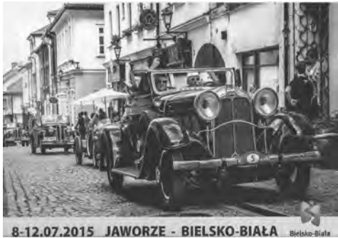
8-12.07.2015 JAWORZE - BIELSKO-BIALA Bielsko-Biala