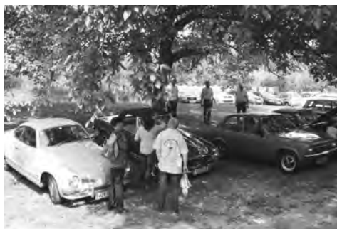
Text: Ewald Bichler

Bauernhof gab's eine kleine Stärkung mit einer Bio-Eierspeise. Danach ging es weiter über St.Veit am Vogau in Richtung Gamlitz an die Südsteirische Weinstraße. Zum Abschluß sind alle Teilnehmer noch auf eine gute steirische Jause zu einer Bio-Buschenschank gefahren.