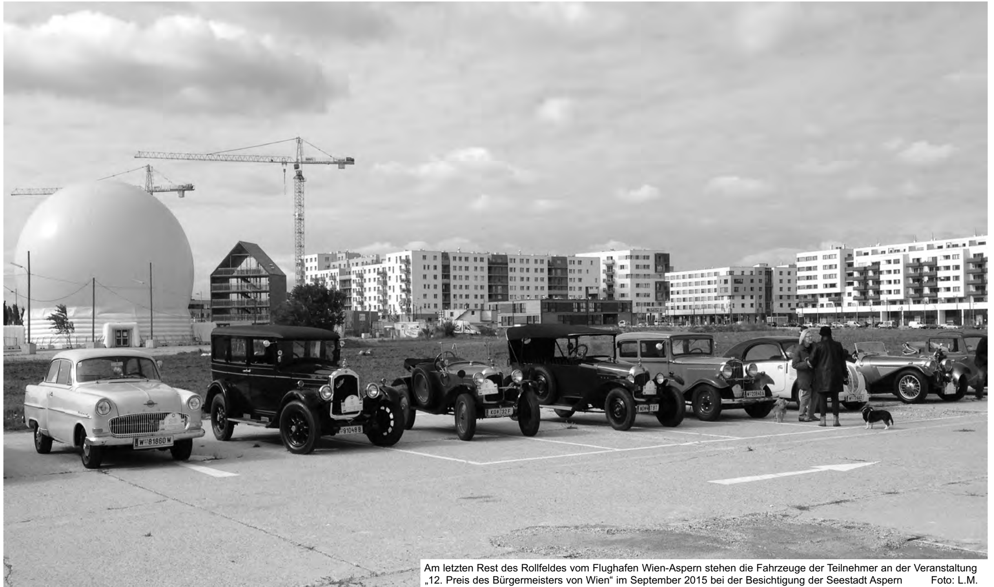
Am letzten Rest des Rollfeldes vom Flughafen Wien-Aspern stehen die Fahrzeuge der Teilnehmer an der Veranstaltung „12. Preis des Bürgermeisters von Wien“ im September 2015 bei der Besichtigung der Seestadt Aspern