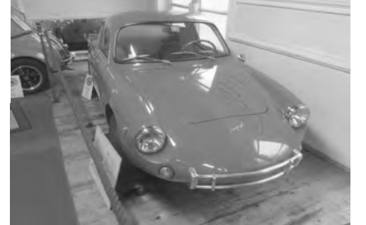
Puch IMP 700 GT - z.Z. ausgestellt in Stockerau im Siegfried Marcus - Automobilmuseum

Nun ein paar wirtschaftliche Referenzpunkte, um deutlich zu machen, was einem der Autoerwerb damals abverlangte. Ein WIFO-Bericht nennt für das Österreich von 1957 bei „realer Kaufkraft“ pro Arbeitseinkommen einen Durchschnitt von 1.652,- Schilling pro Monat. Das Bruttoeinkommen pro Arbeitnehmer betrug monatlich im Schnitt öS 1.640,- für Arbeiter, öS 3.036,- für Angestellte und öS 2.840,- für Beamte.