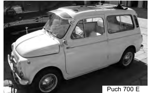
Puch 700 E

Es gab auch in Österreich Sonderkarosserien wie den Imp und das Unikat Puch Jamos GT.