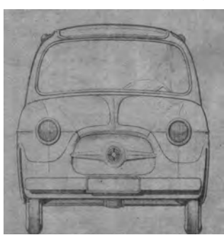
Zeichnung der Front des U2