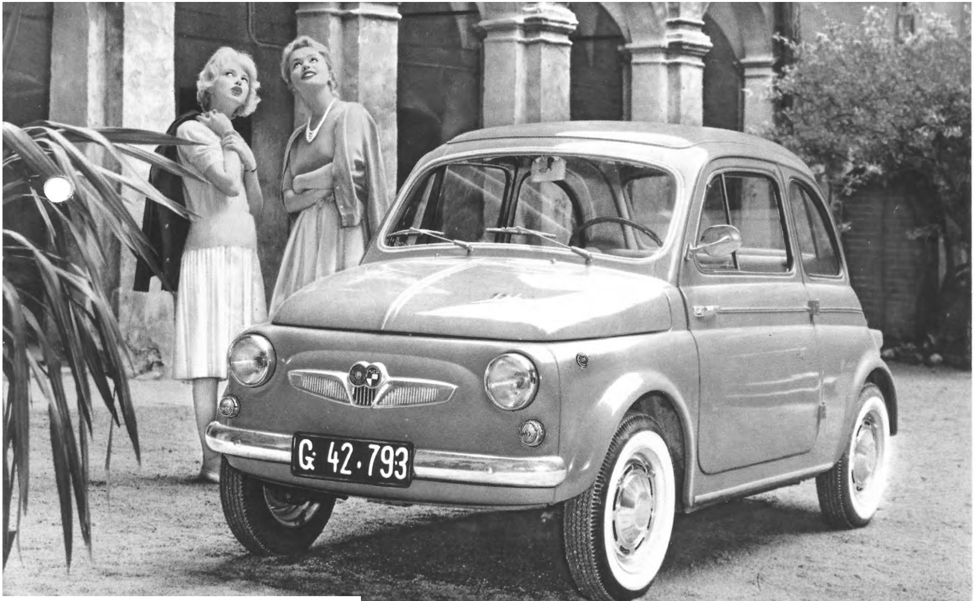
Der Steyr Puch 500 wird 60 Jahre alt - siehe Artikel Seite 2