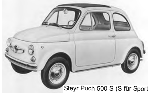
Steyr Puch 500 S (S für Sport)

Ab dem Jahr 1968 wurde das Basismodell des Puch 500 aus Kostengründen immer mehr „fiatisiert“. Das heißt, es entfielen etliche teure Grazer Komponenten zugunsten italienischer