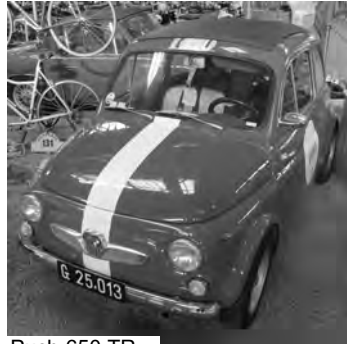
Puch 650 TR

mit seinem Pucherl längs durch den gesamten afrikanischen Kontinent von Kairo nach Kapstadt und durch die Sahara retour. Berichten zufolge bis auf einen neuen Ölfilter ohne jeglichen technischen Defekt!