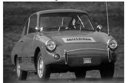
Jamos GT - Bj. 1962 - Einzelstück

Das Pucherl bewährte sich auch als Flottenfahrzeug bei Post, Bundesheer und Gendarmerie, ebenso bei den Autofahrerclubs und bei Sicherheitsdiensten. Auch mancher Feuerwehrhauptmann war einst per Puch-Schammerl unterwegs.