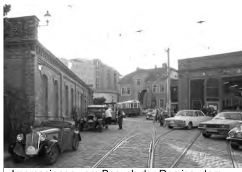
Impressionen vom Besuch der Remise, dem Verkehrsmuseum der Wiener Linien