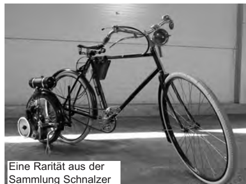
Eine Rarität aus der Sammlung Schnalzer

Das Feuerwehrmuseum Groß St. Florian brachte das „Jausenmoped“ der Wiener Berufsfeuerwehr, eine betagte „Stangl-Puch“, die zum besagten Zweck noch im Einsatz ist. Während der Schau stellten einige Besucher ihre Fahrzeuge mitten in die Ausstellung. Das ausgefallenste Moped war dabei sicher die Puch MS 50 SA von 1966, ein „Maurer-Bock“ in der seltenen Automatik-Ausführung. Die Schau ging aber auch zu einigen Motorrädern über. So kam zum