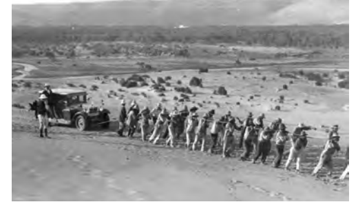
Der Adler mußte in den Cordillere gezogen werden