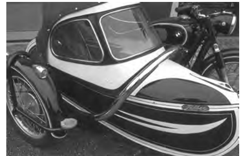
Text und Fotos: LG Steiermark-Ost