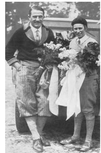
Stinnes und Söderström bei der Rückkehr in Berlin 1929

In den 1920er Jahren war Clärenore Stinnes der