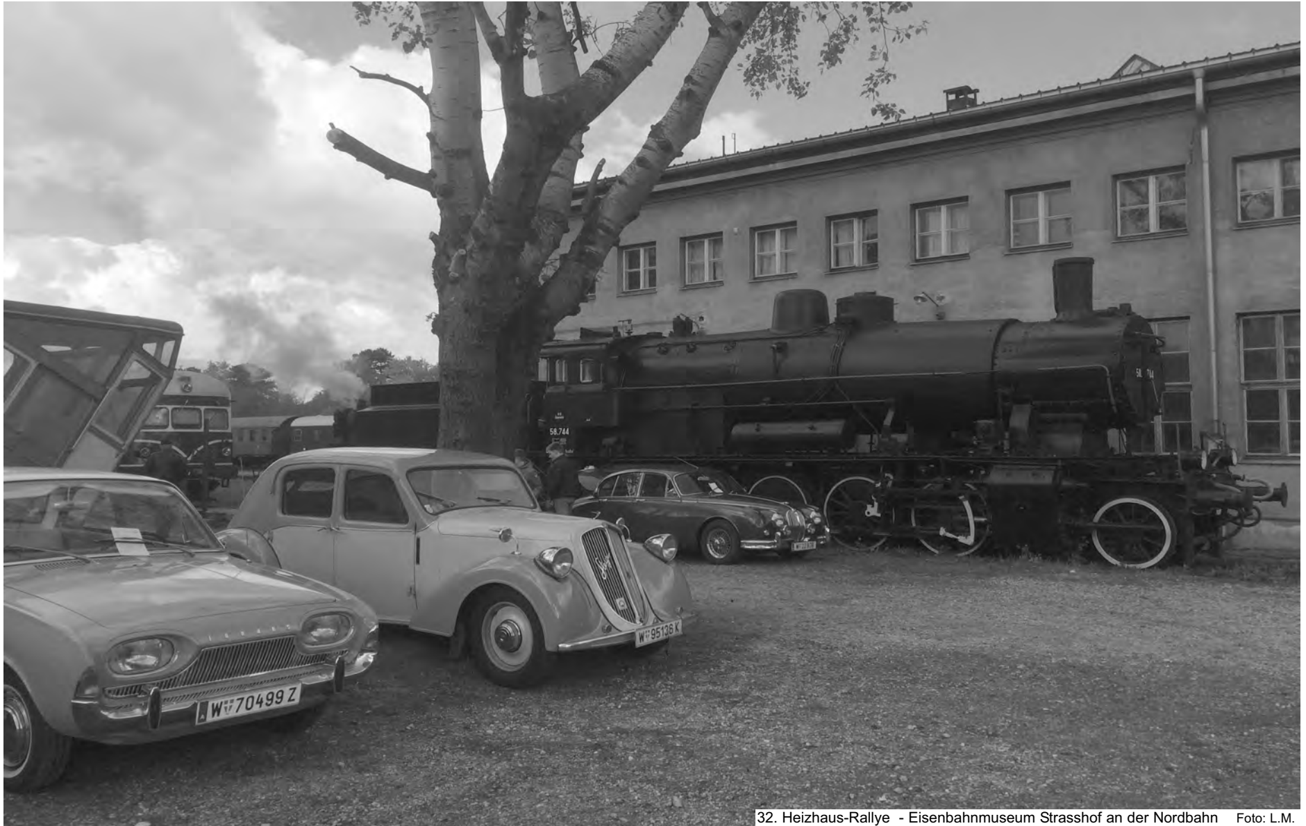
32. Heizhaus-Rallye - Eisenbahnmuseum Strasshof an der Nordbahn