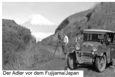
Der Adler vor dem Fujijama/Japan

Mittels Schiff und Frachter ging ihre Fahrt von