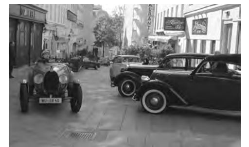
Text: H.M.

Einen Bericht mit vielen Fotos finden Sie in der VOZ: http://www.voz.co.at/2017A/20170501.pdf