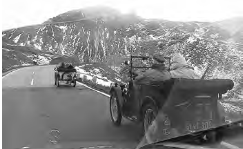
Die beiden Dixi's am Weg zum Hochtort

Alle meine Verwandten und Bekannten rieten mir dringend von diesem Vorhaben ab