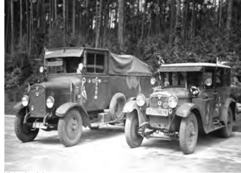
Die beiden Expeditionsfahrzeuge

Mit einem vierköpfigen Expeditionsteam sowie ihrem Hund Lord startete Clärenore Stinnes am 27. Mai 1927 ihre Weltumrundung durch 23 Länder. Im Gepäck 128 hartgekochte Eier,