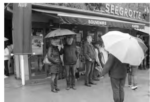
Vor der Seegrotte

Bei der 1 ½ stündigen Führung, mit Bootsfahrt, wurde über die Entstehungsgeschichte, die jeweilige Verwendung, bis hin zur heutigen Fremdenverkehrsattraktion der Grotte, berichtet. Immerhin besuchen die, als Schaubergwerk ausgebaut „Seegrotte“, jährlich bis zu 250.000 Personen.