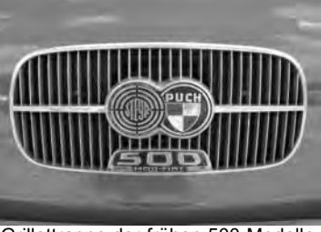
Grillattrappe der frühen 500-Modelle genannt der „Kanaldeckel“