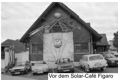
Vor dem Solar-Café Figaro

Wir konnten am 7. Mai zu unserer Frühjahrsausfahrt wieder viele Oldtimer-freunde mit ihren Autos und Motorrädern begrüßen. (96 gemeldete Starter)