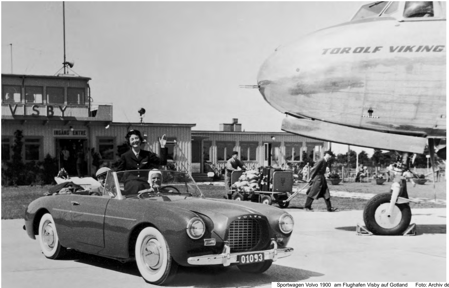
Sportwagen Volvo 1900 am Flughafen Visby auf Gotland