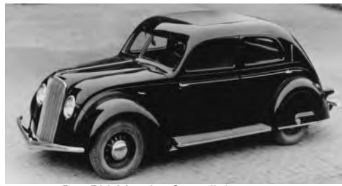
Der PV 36 - der Stromlinienwagen

In den 1930er-Jahren brachte Volvo eine Vielzahl neuer Fahrzeuge auf den Markt. Die größte Innovation war 1936 der PV36, der erste „stromlinienförmige Volvo“ mit 3,6 Litern Hubraum und einer Leistung von 80 bzw. 84 PS. Er verfügte über eine geteilte Frontscheibe, Abdeckungen für die Hinterräder, einen integrierten Kofferraum und war als besonders geräumiger 6-Sitzer konzipiert.