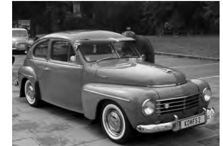
einem Volvo PV 444 ES, Bj. 1953.

Dort beim Schurl-Wirt wurde dann fleißig gerechnet und ein Sieger ermittelt. Das Siegerteam saß in