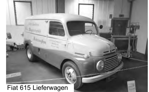
Fiat 615 Lieferwagen

Pabneukirchen ( www.autohaus-ambros.at/oldtimermuseum ) beherbergt zahlreiche italienische