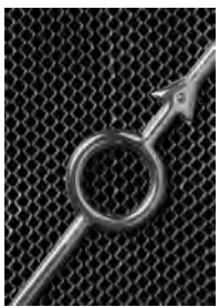
Das Markenzeichen am Volvo ÖV 4

Von Anfang an wurde beim Volvo Automobilbau auf Qualität, Sicherheit und Zuverlässigkeit Bedacht genommen; schon der Volvo „Jakob“