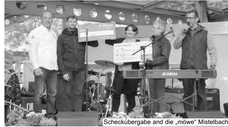
Scheckübergabe an die „möwe“ Mistelbach