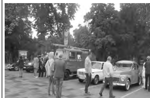
Die Teilnehmer beim Start in Wolkersdorf

der Früh noch ordentlich regnete. Die Teilnehmer erhielten Roadbook, Vormittagsaufgaben und fuhren dann ab 9 Uhr im 30 Sekunden Takt los.