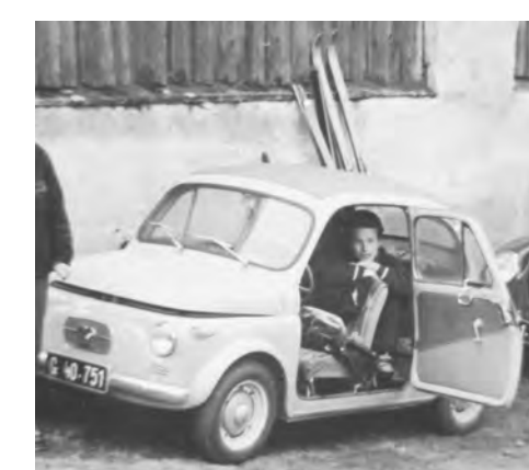
Das Foto stammt aus dem Jahr 1961. Mit dem 500er ging's mit meinen Eltern zum Schifahren! Von der Reise in die Türkei, die wir mit diesem 500er vollbrachten, gibt es leider keine Fotos, da wir beide, meine Freund Anton und ich, keinen Fotoapparat besaßen.

Meines Vaters 500er namens „Jaki“ brachte uns brav nach Graz zurück. Leider gab bald danach der Motor seinen Geist auf und ich musste ihn entsorgen. Heute weiß ich, daß es schade ist, dass ich die graue Maus nicht behalten habe.