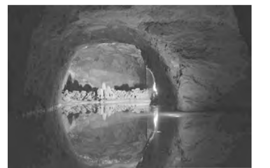
der große See

Auch wenn sich Petrus nicht von seiner besten Seite gezeigt hat, war die Herbstausfahrt 2017 gelungen, wir danken den Initiatoren und ihrem