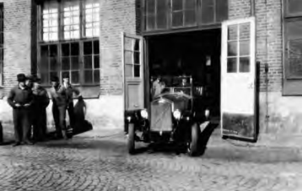
Der erste Personenwagen - der ÖV 4 -rollt durch das Werkstor

Die Wurzeln der Volvo Automobilfabrik liegen in