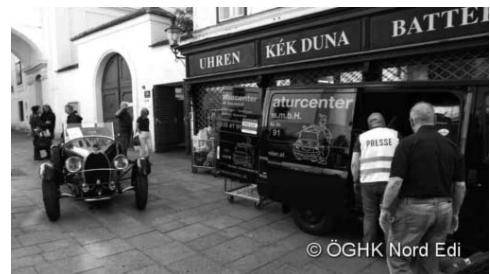
Um 10:15 Uhr verließ die Kolonne der histori-

Das Entladen des mit den vielen Gütern voll beladenen Transporters hat heuer lange gedauert. Die Zeit nutzten viele Fahrteilnehmer zu einer Führung durch die Räume der Unterkirche der Mariahilfer Kirche – der „Gruft“.