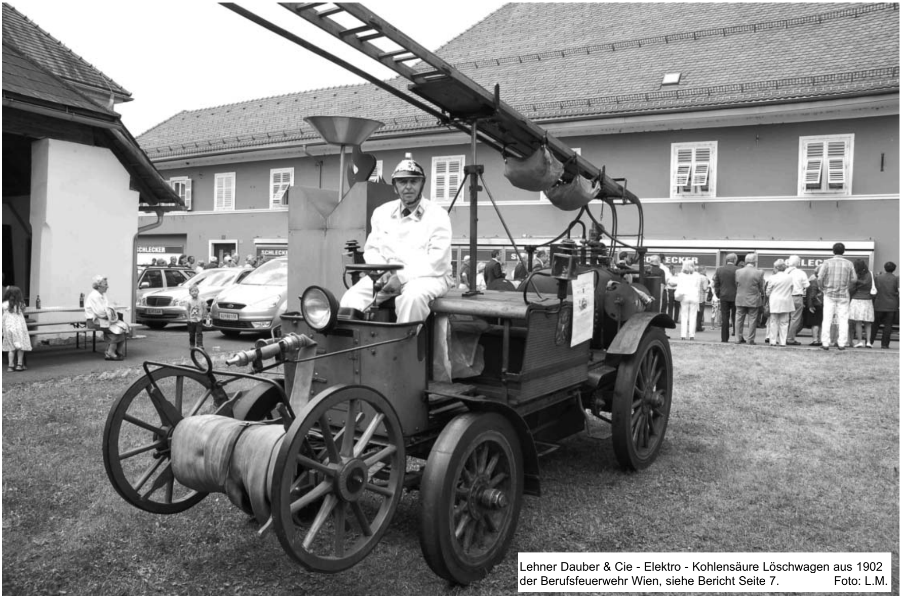
Lehner Dauber & Cie - Elektro - Kohlensäure Löschwagen aus 1902 der Berufsfeuerwehr Wien, siehe Bericht Seite 7.