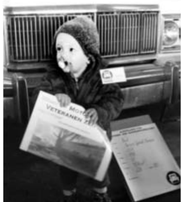
auch für den Nachwuchs in der Museumsleitung ist bereits gesorgt!

Weitere Infos: http://www.kraftfahrzeugmuseum.at Telefonische Auskunft: 0664/3035772