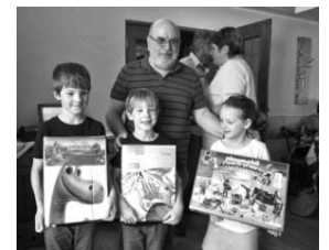
Auch für sie gab's kleine Geschenke.