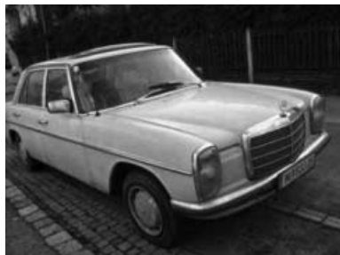
Mercedes Benz 240D 3.0, DIESEL 3000ccm,

5 Zylinder, Automatik, Servolenkung, Schiebedach elektrisch, elektrische Fensterheber, ganz seltene Luxusausführung, wenige Modelle noch im Betrieb, Oldtimer. Pickerl bis Ende 2018, und Vignette 2018. Verkaufspreis: 17.000,00 Euro Odo SCHINDLEGGER e-mail: office@scs-med.at