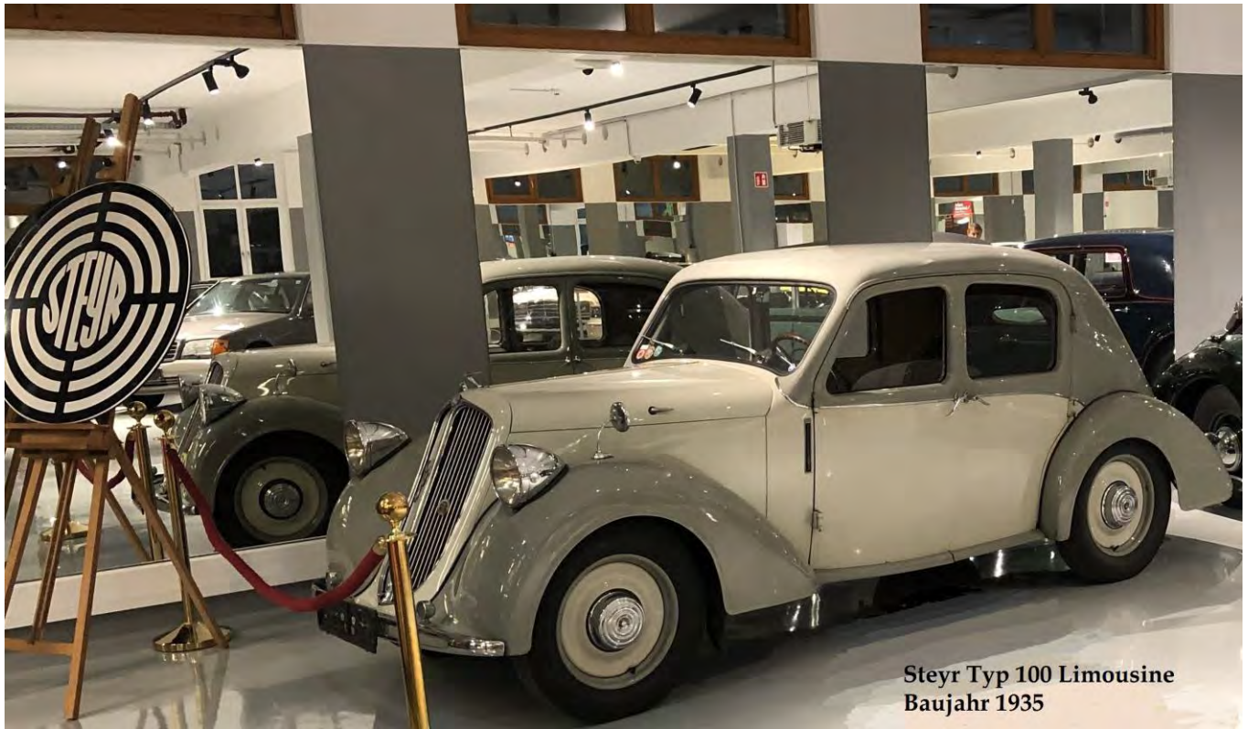
Steyr Typ 100 Limousine Baujahr 1935