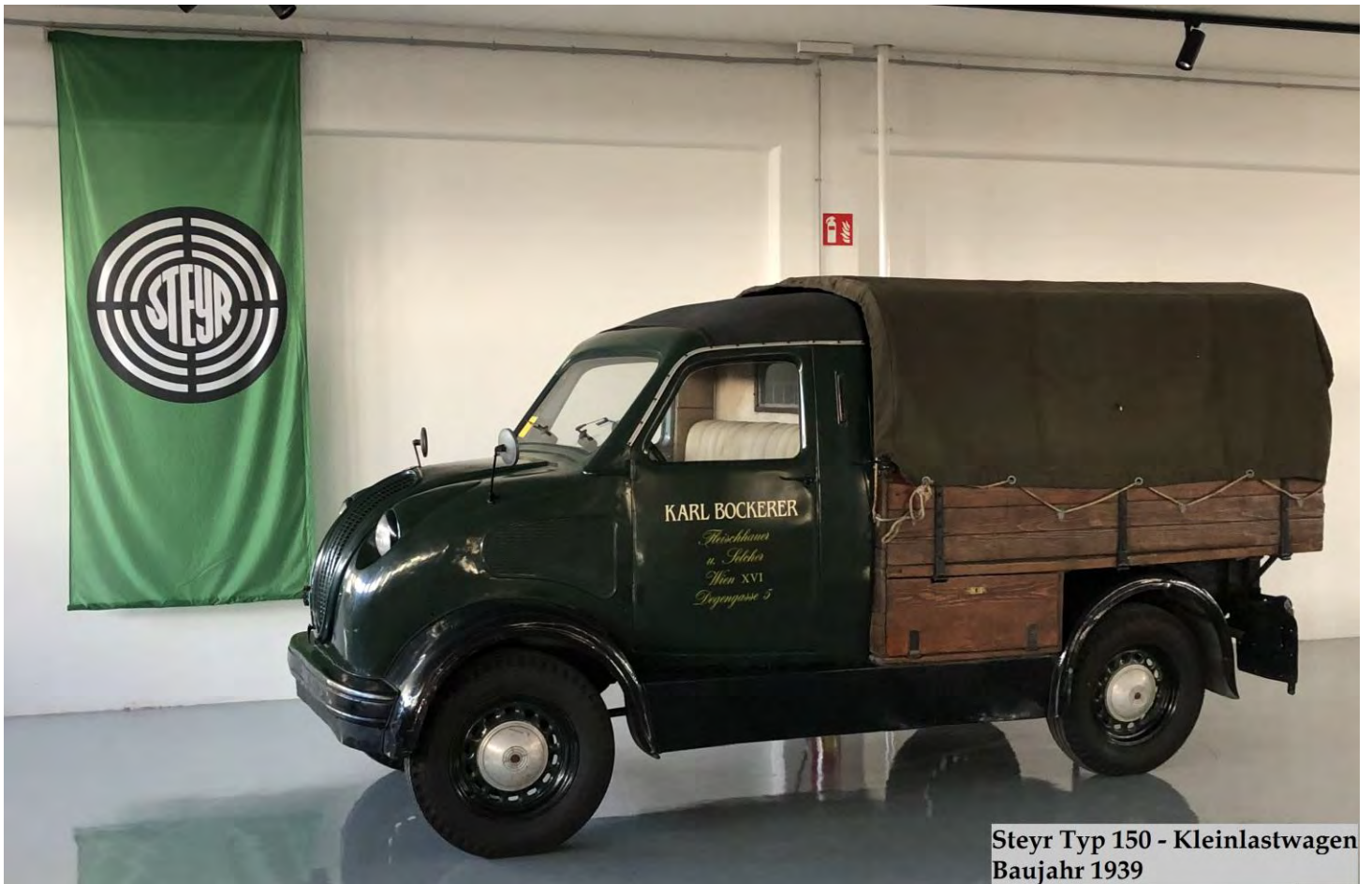
Steyr Typ 150 - Kleinlastwagen Baujahr 1939