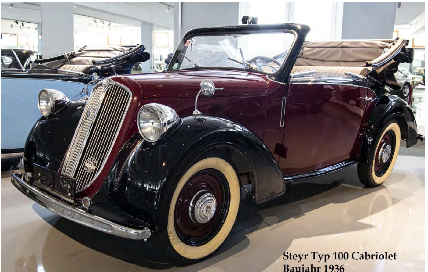
Steyr Typ 100 Cabriolet Baujahr 1936