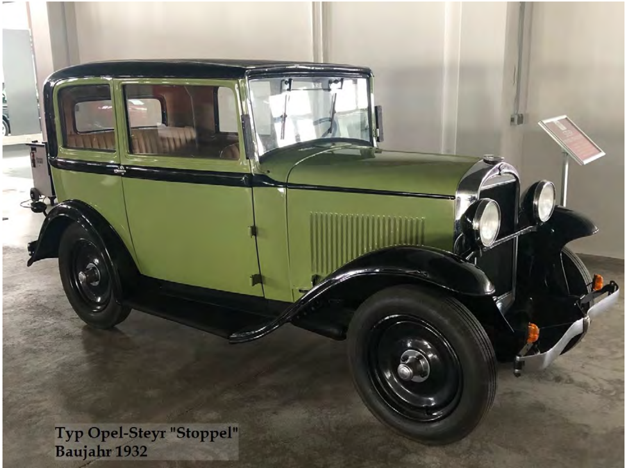
Typ Opel-Steyr "Stoppel" Baujahr 1932