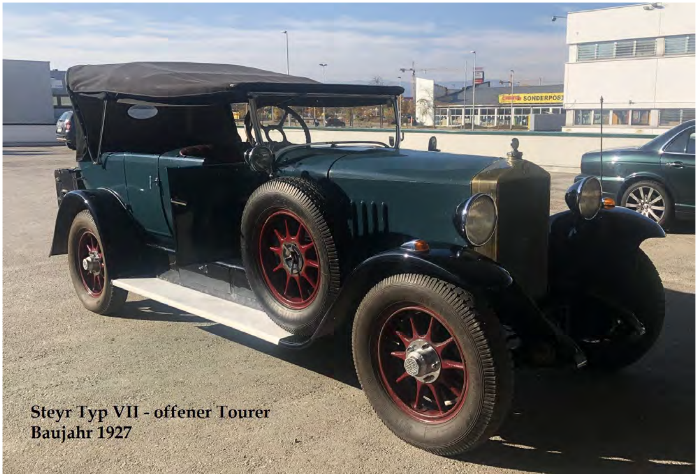
Steyr Typ VII - offener Tourer Baujahr 1927