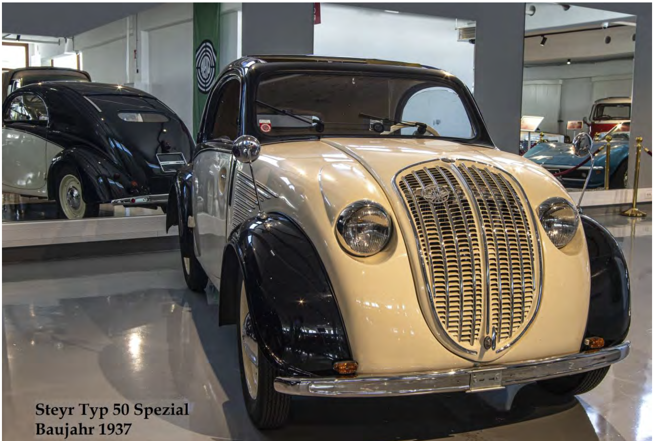
Steyr Typ 50 Spezial Baujahr 1937