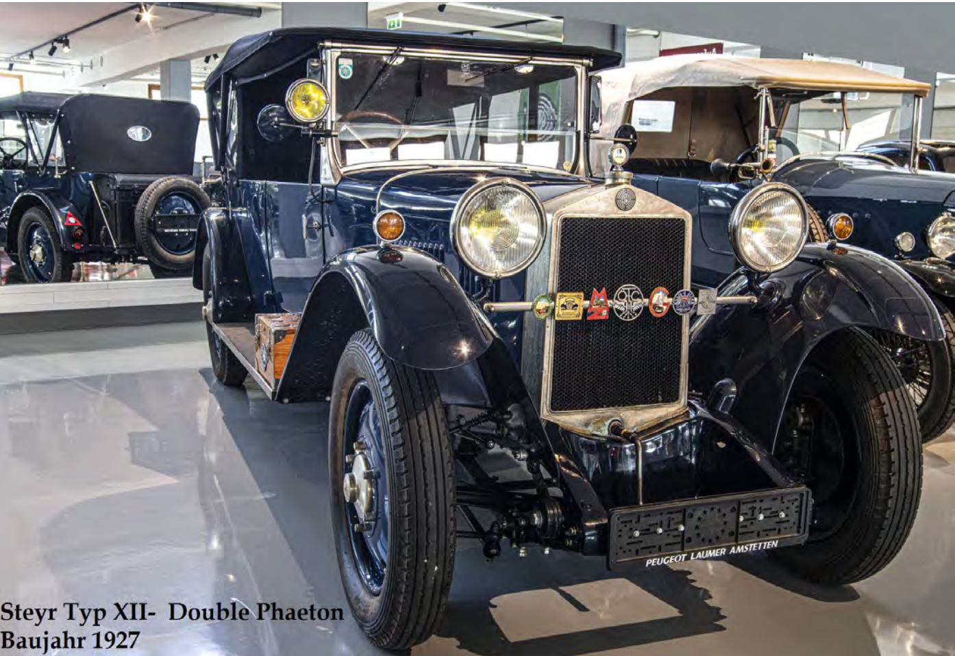
Steyr Typ XII- Double Phaeton Baujahr 1927