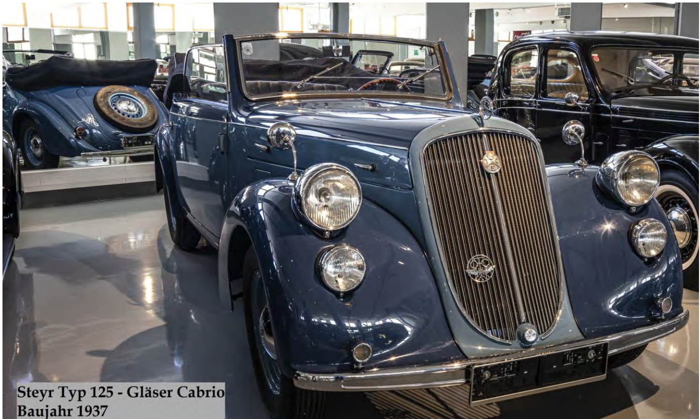
Steyr Typ 125 - Gläser Cabrio Baujahr 1937