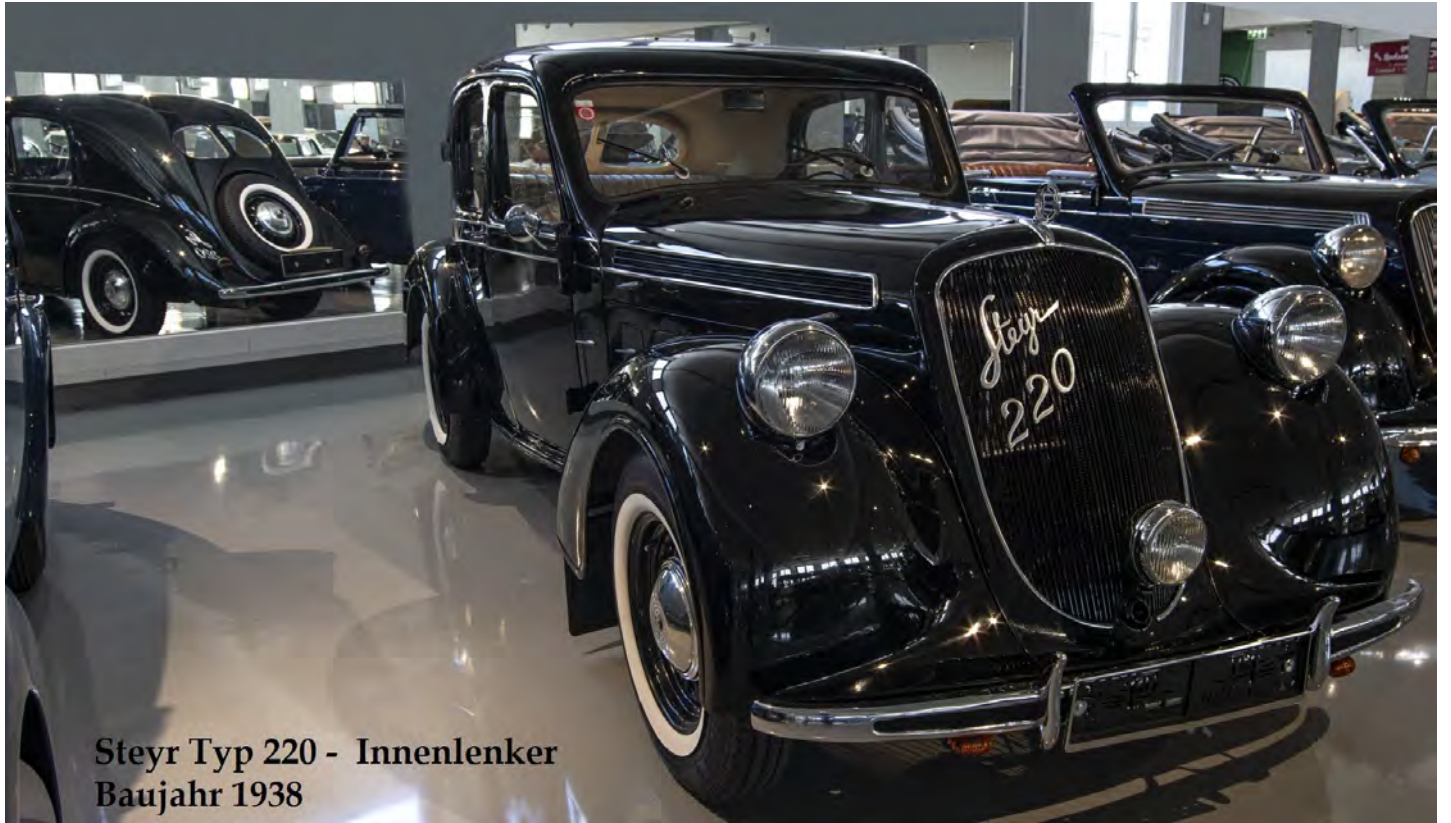
Steyr Typ 220 - Innenlenker Baujahr 1938