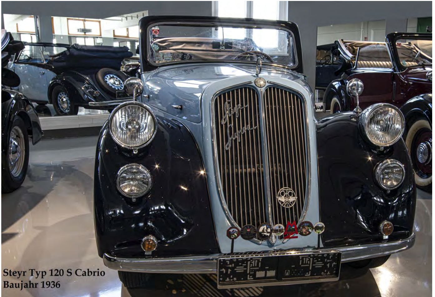
Steyr Typ 120 S Cabrio Baujahr 1936