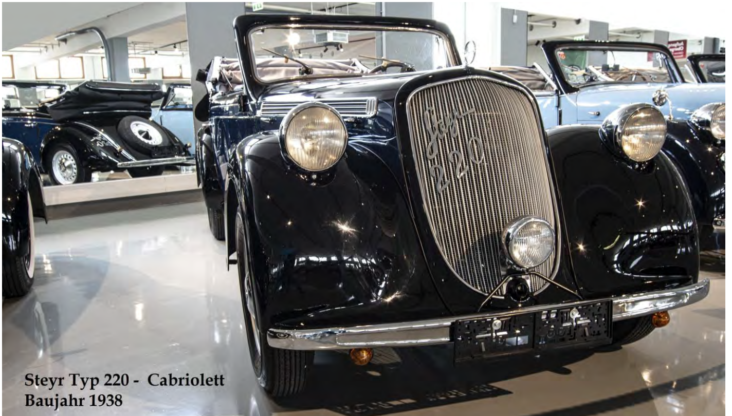
Steyr Typ 220 - Cabriolett Baujahr 1938