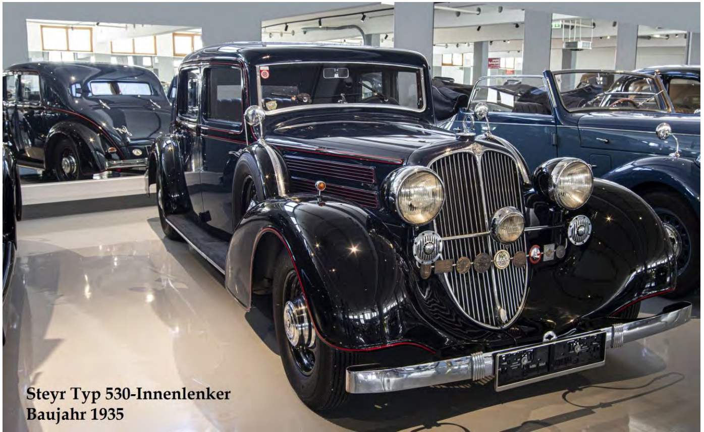
Steyr Typ 530-Innenlenker Baujahr 1935